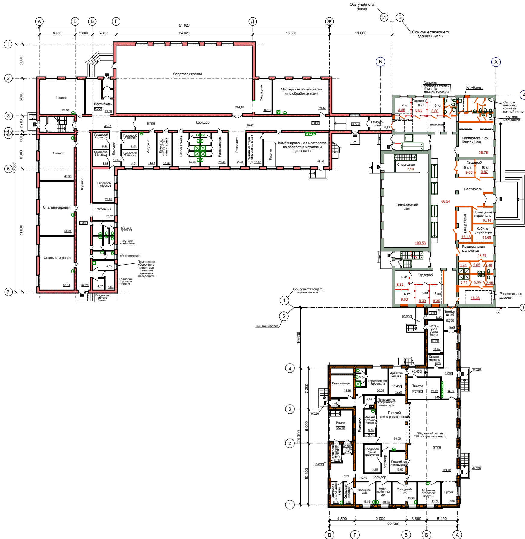
Компоновочный план 1 этажа

Реконструируемая школа представляет собой П-образное здание со скатной кровлей с встроенной частью спортзала в уровне техподполья, с размерами в осях 20,55x37,21м.